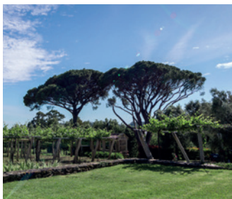
VIÑEDOS: Finca A Cheira y finca Sobral.

Una bodega histórica del Rosal precursora de la D.O. Rías Baixas, llena de encanto y tradición. Su historia centenaria y su carácter familiar la convierten en una de las decanas de la calidad y diferenciación del vino del Rosal.